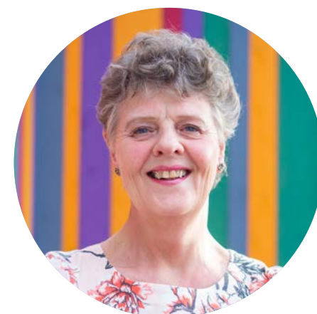
Tea Adema Trainer, coach, vakvrouw voor professionals, ouders en kinderen